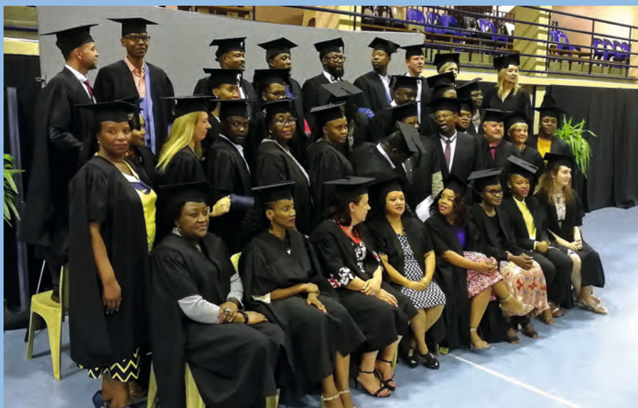
Etelä-Afrikan Pretoriassa on juhlittu jo monta kertaa valmistujaisia 60 opintopisteen laajuisesta Vocational Teacher Education Programme with a Finnish Touch -ohjelmasta.

Haaga-Helian ohjaajat ovat olleet fasilitoimassa pedagogista muutosta, jossa TUT:n opettajien kohtaamat kehittämisponnistukset ovat olleet osittain samoja kuin suomalaisissa korkeakouluissa. Osaamisperustainen koulutus, osallistava ja yhteisöllinen pedagogiikka