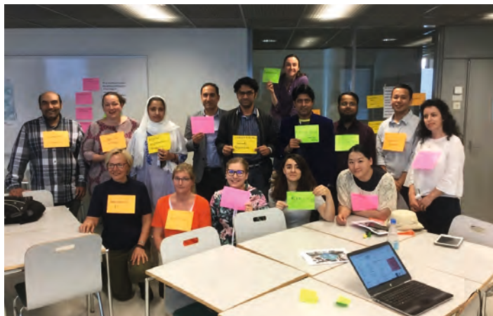
Students of the international teacher education programme 2019–2020.